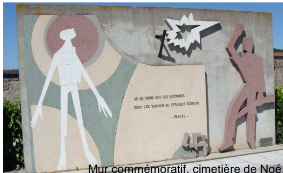
Mur commémoratif, cimetière de Noé

Alimentés depuis les camps de concentration du Portet-Récébédou, Noé, Le Vernet d'Ariège, de nombreux convois d' « indésirables » (répression raciale ou politique) sont partis via Toulouse vers les camps nazis (Auschwitz, Dachau, Mauthausen, Neuengamme, Ravensbrück...). D'autres vers les camps pétainistes d'Afrique du Nord.